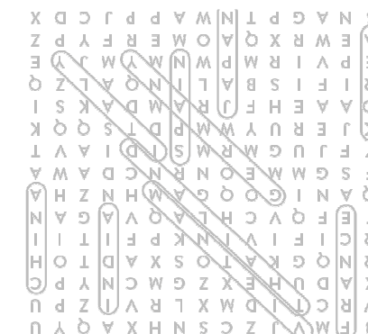
WORD SEARCH GAME